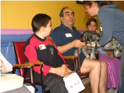
Rencontre des élèves du CFM et des aînés du CHSLD Paul-Lizotte

l'école Charles-Bruneau. Cette école accueille des jeunes de 6 à 12 ans qui ont besoin d'aide pour améliorer leur comportement.