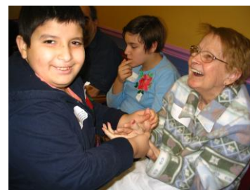
Jamais nettoyage de main n'aura été aussi rigolo.

Un projet intergénérationnel est venu enrichir le programme d'activités en offrant aux jeunes des occasions de visite aux aînés résidant au CHSLD Paul-Lizotte. Cette initiative a été particulièrement réussie puisque jeunes et aînés ont de toute évidence fait un contact chaleureux à chacune de leurs rencontres. Les jeunes préparaient pendant quelques semaines ce rendez-vous très attendu. Chacun y tenait un rôle (présentations, explications du déroulement, offrir aux aînés la possibilité de prendre un chien, installer une serviette sur les genoux, nettoyer les mains) dont il s'acquittait avec un empressement exemplaire.