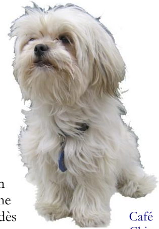
Café Chien bénévole

Difficile pour un observateur qui, à partir de son expérience avec son animal familier, tente de faire un parallèle avec un chien de Zoothérapie Québec. D'abord, ils sont plus de 30 dans le bureau, ce qui en soit comporte déjà un 1 er niveau de difficulté. Mais surtout, chaque chien utilisé en zoothérapie est très sollicité et très stimulé et ce, par de très nombreuses personnes – famille d'accueil, bénévoles, intervenants, clients et gardiens d'occasion – dans des environnements tout aussi nombreux et différents. Dans ce contexte, le chien n'est pas sans réagir et chaque comportement fait l'objet d'observations, de questionnements, de tentatives d'explications et d'interventions pour corriger un comportement indésirable qui surgit d'on ne sait où. Le fait que chaque chien soit en relation avec autant de gens qui agissent et interagissent tous si différemment avec lui ne facilite en rien l'affaire. Au contraire, le niveau de difficulté est énorme quand on sait que la correction d'un comportement non souhaité requiert une cohésion rigoureuse de toutes les parties. On ne l'a pas facile. On peut dès lors deviner pourquoi une ressource est si primordiale.